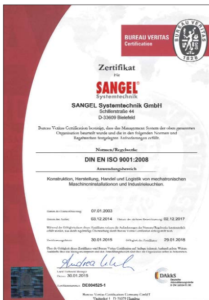
Sichere Prozesse – mit Zertifikat Secure processes – with certification